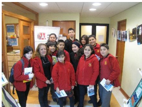
Alumnos/as y profesores participando en el programa “Descubriendo el Archivo Histórico de San Bernardo”.