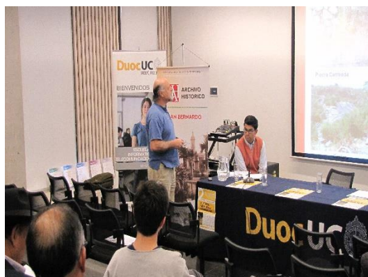
Afiche e imagen de las IIº Jornadas de Estudios Locales organizadas por el Archivo Histórico Comunal de San Bernardo