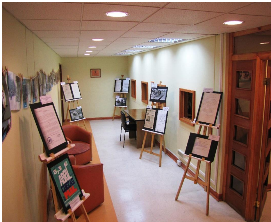
Exposición con reproducciones facsimilares realizadas con motivo del Día del Patrimonio 2013 en las dependencias del AHCSB.

La temática de la exposición tienen una variación cada mes destacando temas de diversa índole como: programas de aniversario, figuras políticas locales, festividades civiles, religiosas o culturales, deporte local, etc.